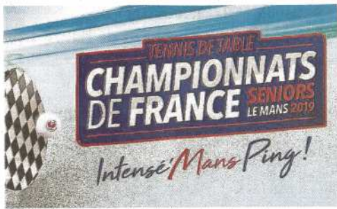
Entrée à Antarès, 10 €, pour les finales de ce dimanche.